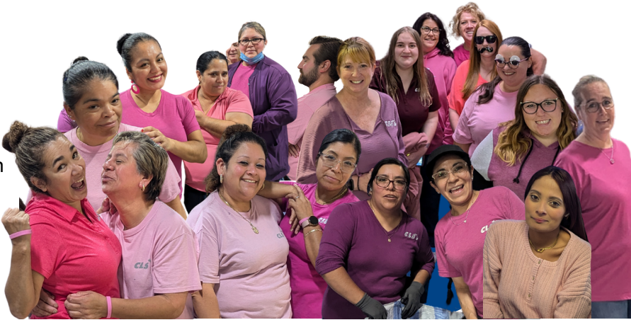
¡Extrañamos a todos los increíbles miembros del equipo que se vistieron de rosa pero no aparecen en esta foto!

¡Gracias a TODOS los que se tiñeron de rosa durante octubre! Su apoyo fue un mensaje contundente para el Mes de Concientización sobre el Cáncer de Mama. Juntos, hemos creado conciencia y demostrado verdadera solidaridad.